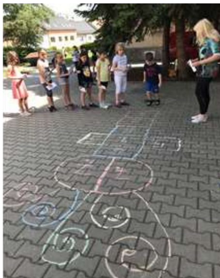
Den dětí – žetony za sportovní výkony si děti vyměnily za odměny na jarmarku