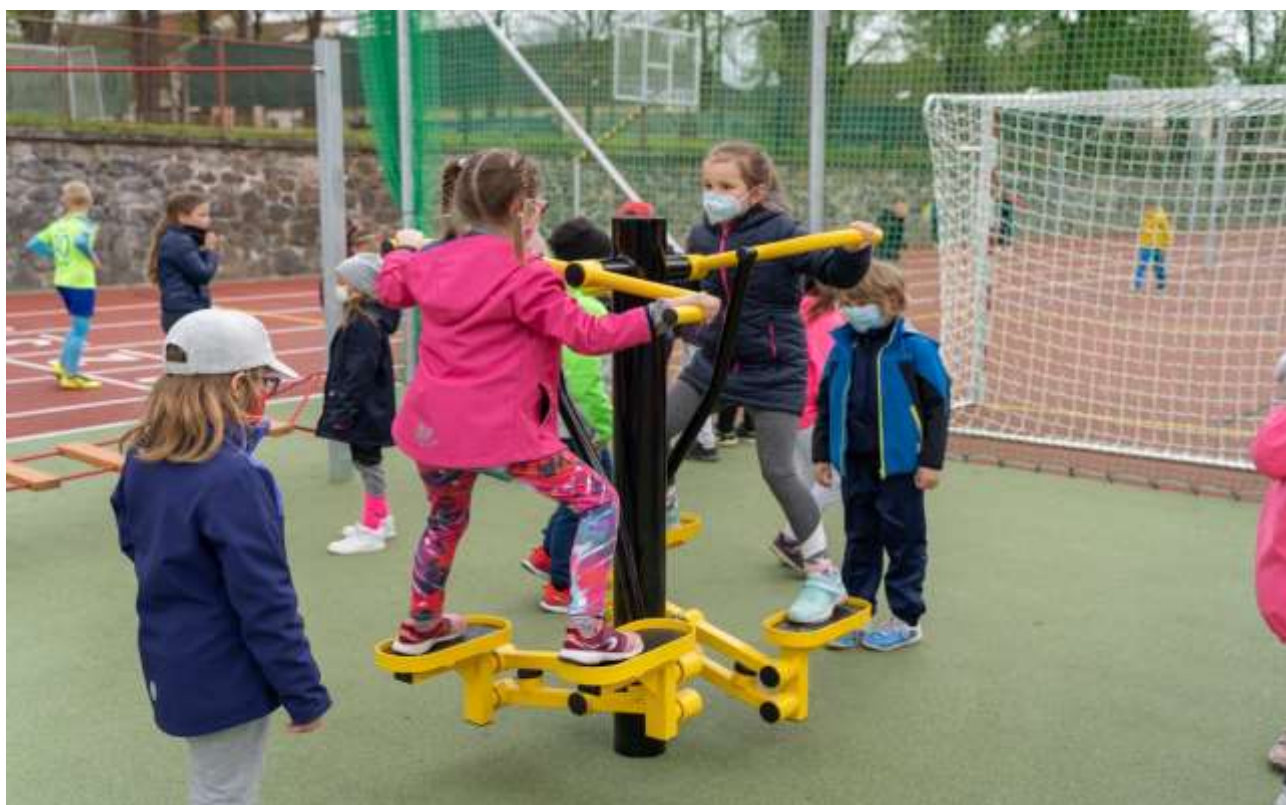
Po otevření hřiště využily děti možnost si vše nové vyzkoušet