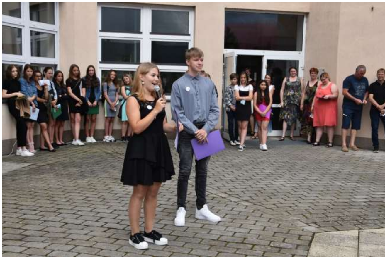
Se svými spolužáky a učiteli se rozloučili zástupci z jednotlivých tříd 9. ročníku.

Školní rok 2020/2021 byl z hlediska organizačního velice náročný. Naše škola ihned reagovala na nařízená opatření či uzavření školy. Distanční výuka byla jasně daná pevnými časy jednotlivých předmětů dle zveřejněného rozvrhu, probíhala ihned od začátku, kdy byly uzavřeny jednotlivé ročníky. Po přechodu na prezenční výuku byli osloveni všichni zákonní zástupci žáků dotazníkem, který se týkal distanční výuky. Velice nás potěšily výsledky hodnocení školy rodiči za distanční výuku. 67 % respondentů z 1. stupně hodnotilo známkou 1 nebo 2, z druhého stupně to bylo 68%.