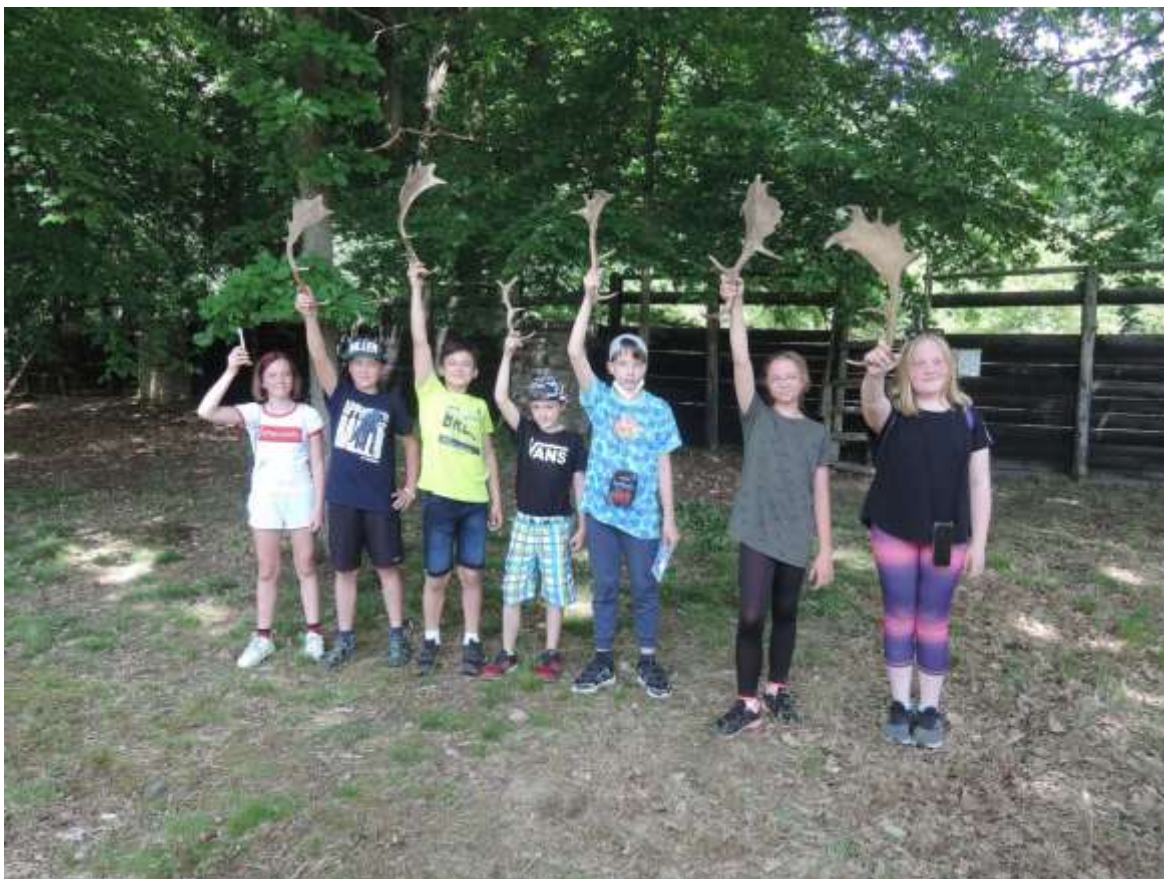
Trofeje z obory Čertáno u Horšovského Týna, které si žáci odvezli domů