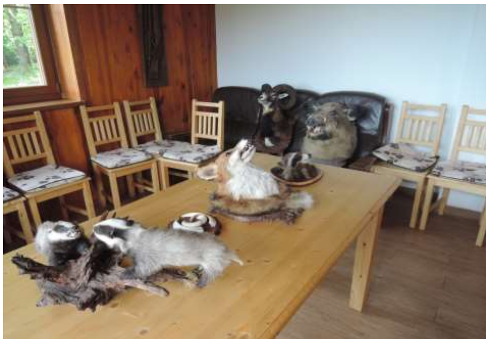
Poznávání zvířat v oboře Čertáno

Jednou z mála akcí byl sběr kaštanů a žaludů na 1. stupni. Kaštany i žaludy se vybíraly i během uzavření škol. Probíhala jak soutěž jednotlivců, tak i celých tříd. Vítězné třídy byly pozvány do obory Čertáno, kde byl pro žáky připraven environmentální program a následně sběr shozů daňků, které si žáci mohli odnést domů. Celá akce, konaná 15. června byla velice zdařilá a přínosná.