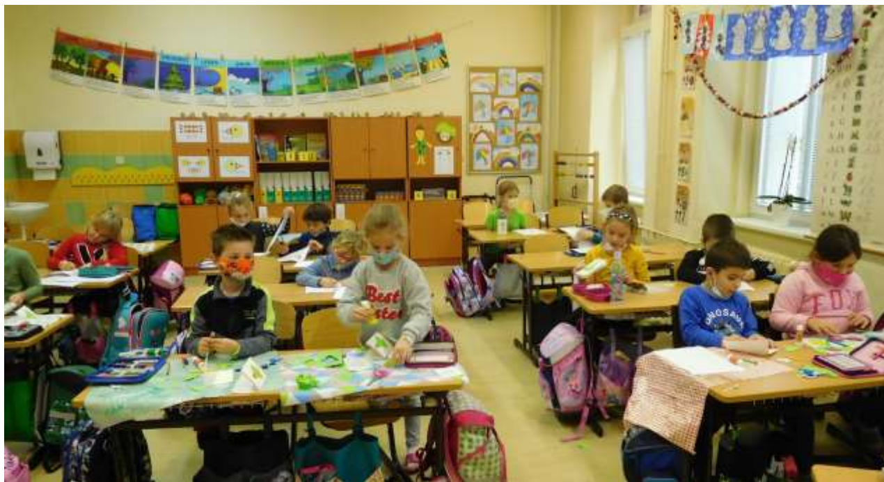
Výroba vánočních přáníček pro seniory žáky 1. ročníku byla jedna z mála typických předvánočních aktivit

Základní škola Josefa Hlávky Přeštice nabízí žákům 8. ročníku vodácký kurz a také výběrový kurz lyžování v Rakousku. V nabídce rozšířených sportovních aktivit je i kondiční plavání. Epidemiologická situace, uzavření bazénů a lyžařských areálů bohužel neumožňovalo realizovat žádnou z nadstavbových aktivit. Nekonaly se ani lyžařské kurzy pro sedmý ročník.