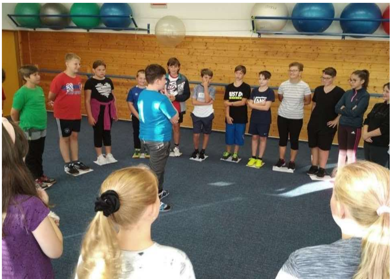
Adaptační kurzy byly jedinou akcí v rámci preventivní činnosti před uzavřením škol