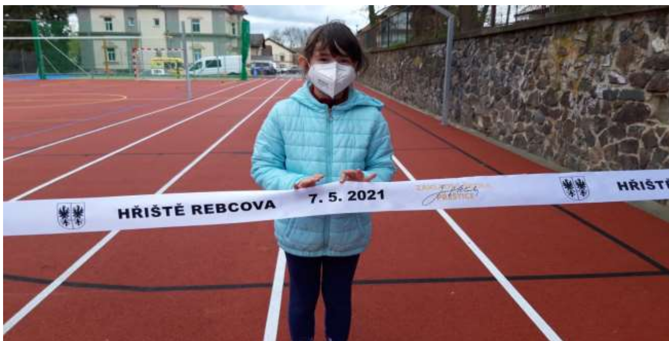
Slavnostní otevření hřiště bylo ovlivněno hygienickými opatřeními

Spolupráce se zřizovatelem byla i ve školním roce 2020/2021 na velice dobré úrovni a především při koordinaci jednotlivých kroků při uzavření či postupnému znovuotevření škol.