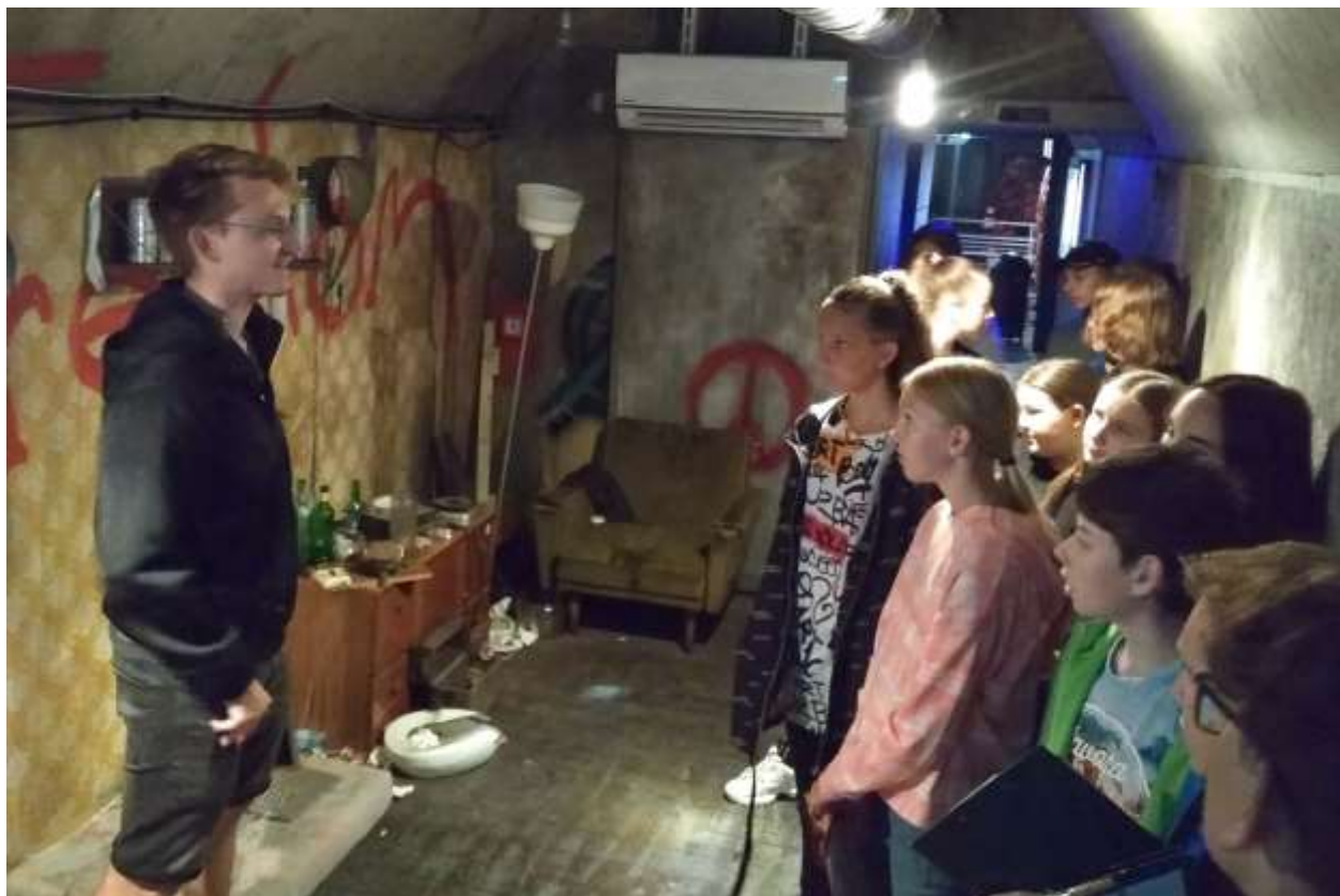
Prostředí při preventivní akci v proti drogovém vlaku bylo velice autentické

Všechny preventivní akce na 2. stupni, s výjimkou adaptačních kurzů, byly ve školním roce 2020/21 z důvodu epidemie koronaviru zrušeny.