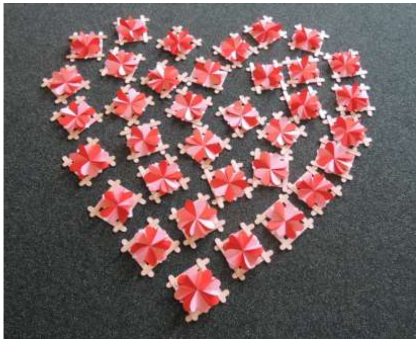
Účast v akci Srdce pro sestry bylo poděkování všem zdravotníkům za zvládnutí těžkého období spojeného s nákazou COVID-19