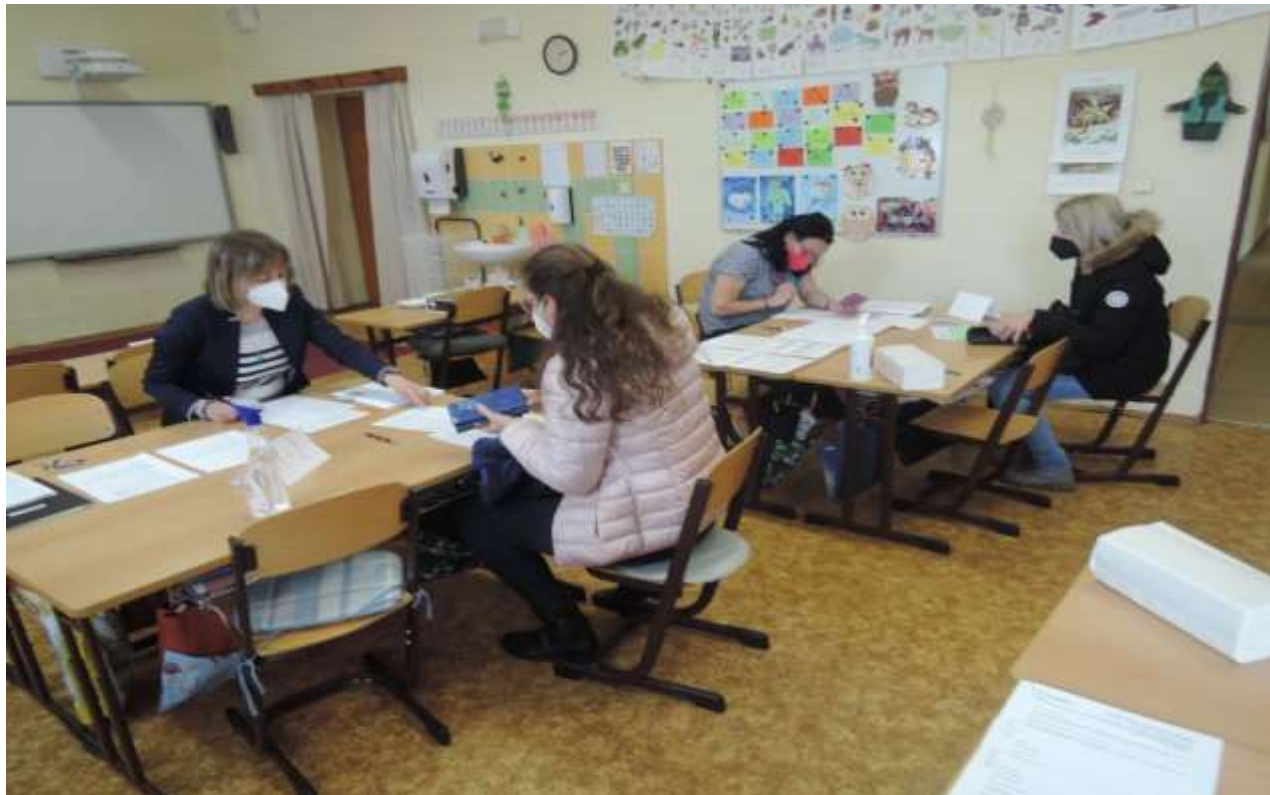
Zápis nových žáků do 1. ročníku se konal opět bez dětí

Mimo projektových dnů a ICT vybavení školy je projekt zaměřen i na další vzdělávání pedagogických pracovníků (DVPP) . Díky tomu se 9 kolegů zúčastnilo týdenní letní jazykové školy při ZČU v Plzni a jeden kolega třídního konverzačního kurzu z anglického jazyka. DVPP v oblasti ICT absolvovalo 8 pedagogů se zaměřením na systém Pasco. Všichni pedagogové, asistentky pedagoga a vychovatelky, celkem 71 osob, absolvovali celodenní školení v oblasti ICT na rozvoj práce v systému Office 365 (Teams) a seznámení s prostředím, ve kterém pak probíhala distanční výuka při opětovném uzavření škol ve školním roce 2020/2021. V oblasti osobnostně sociálního rozvoje jsme prostředky použili na dva dlouhodobé kurzy, Logopedický asistent pro naši asistentku pedagoga a Feuersteinovo instrumentální obohacování pro učitelku 1. stupně. Další kurzy na osobnostně sociální rozvoj byly zaměřené na spolupráci učitele a asistenta pedagoga a komunikaci v krizových situacích. Všichni pedagogičtí pracovníci absolvovali v srpnu 2021 školení s názvem Aktivizující výuka aneb Didaktická strategie „Líného učitele“.