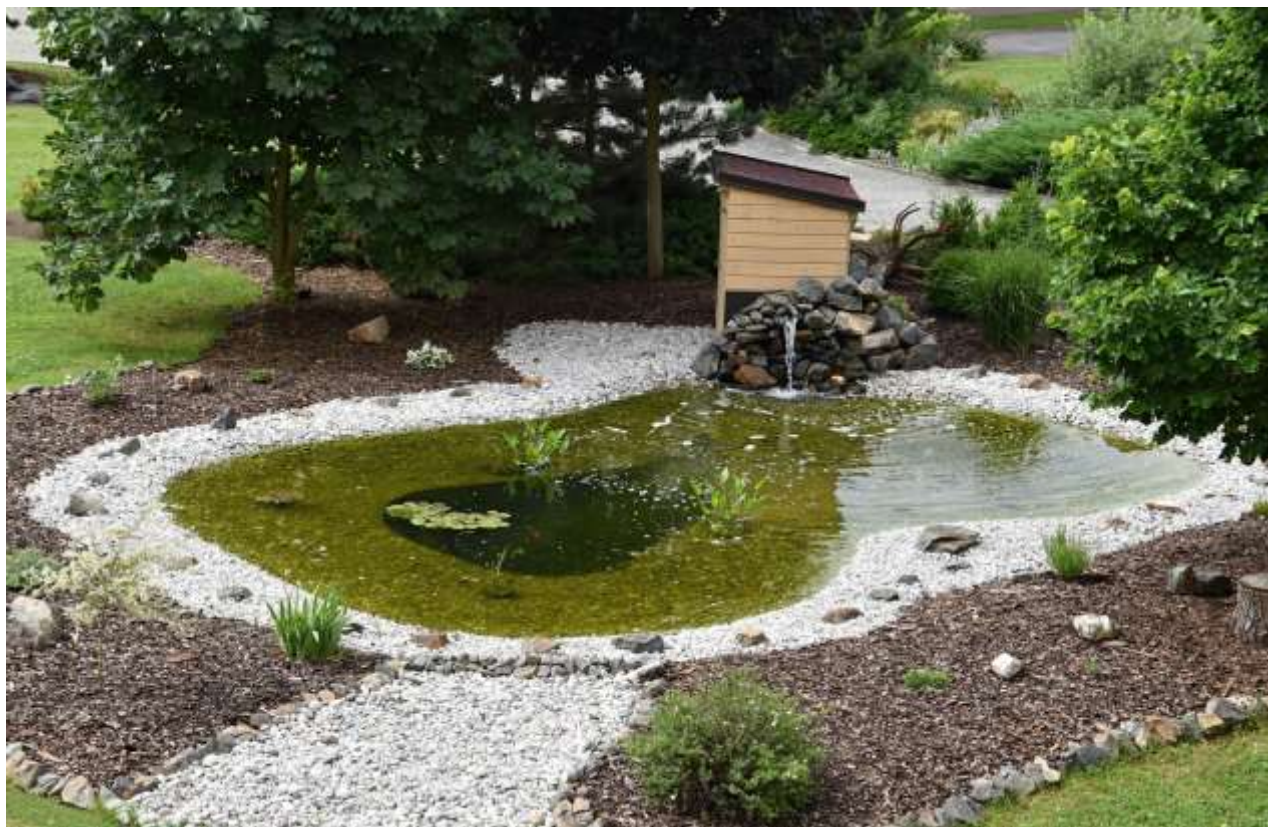
Vodní biotop přispěje i ke zlepšení klimatu v letním čase v atriu školy

Spolupráce se zřizovatelem byla i ve školním roce 2020/2021 na velice dobré úrovni a především při koordinaci jednotlivých kroků při uzavření či postupnému znovuotevření škol.