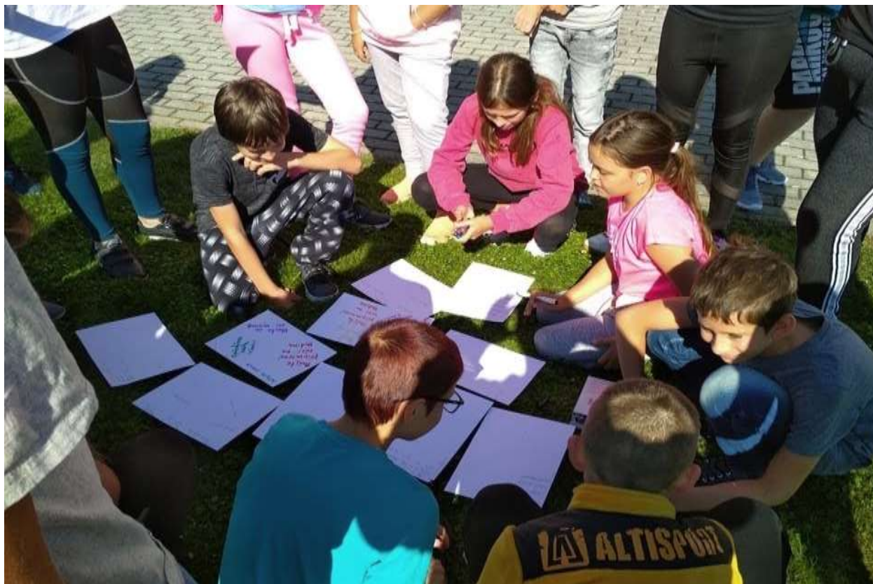
Adaptační kurzy pro 6. ročník jsou významnou aktivitou pro vytváření vazeb v novém kolektivu.