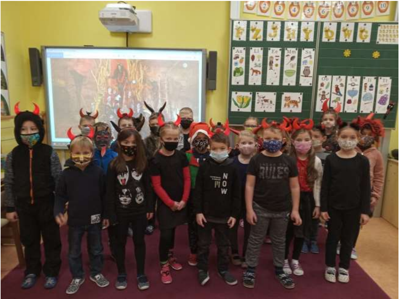
Velice oblíbený den „ČERTÍ ŠKOLY“ proběhl 4. prosince 2020