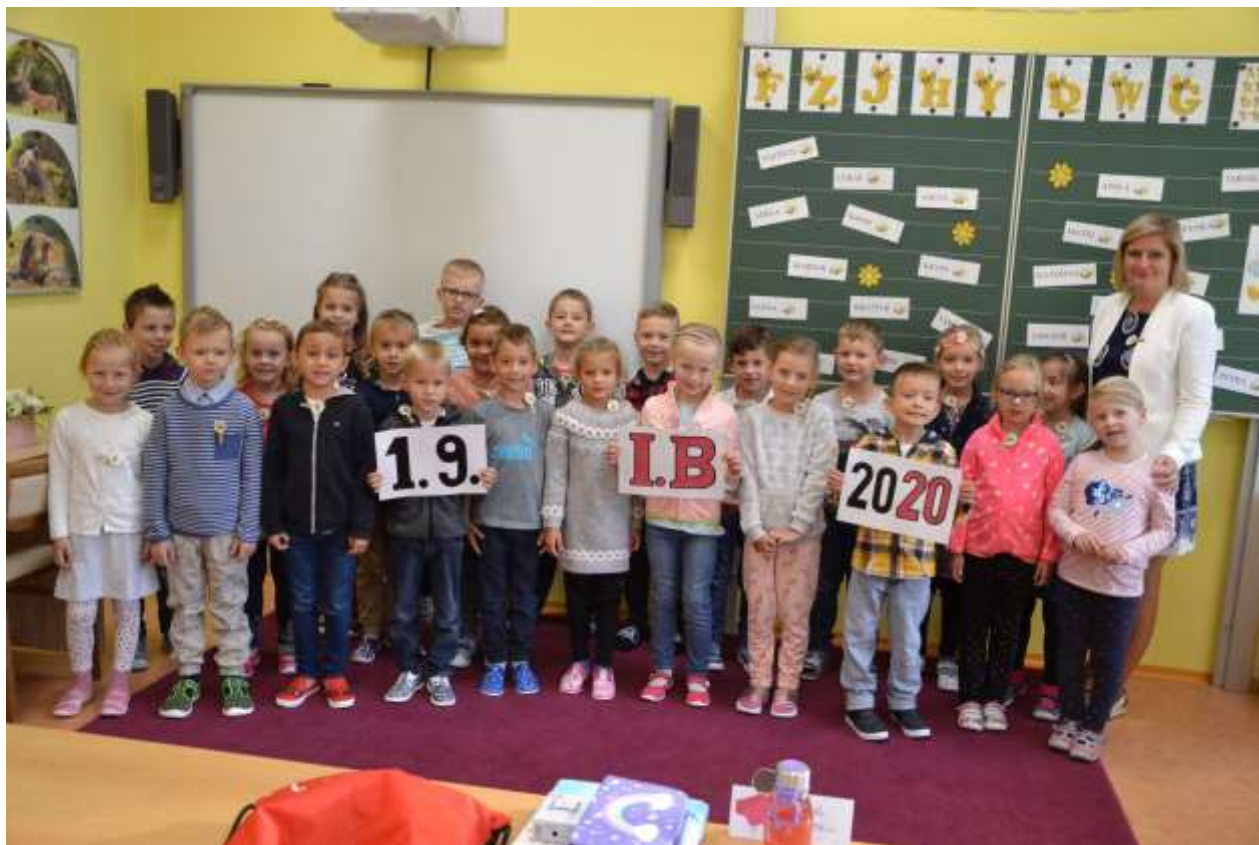
Žáci 1. ročníku ve školním roce 2020/2021