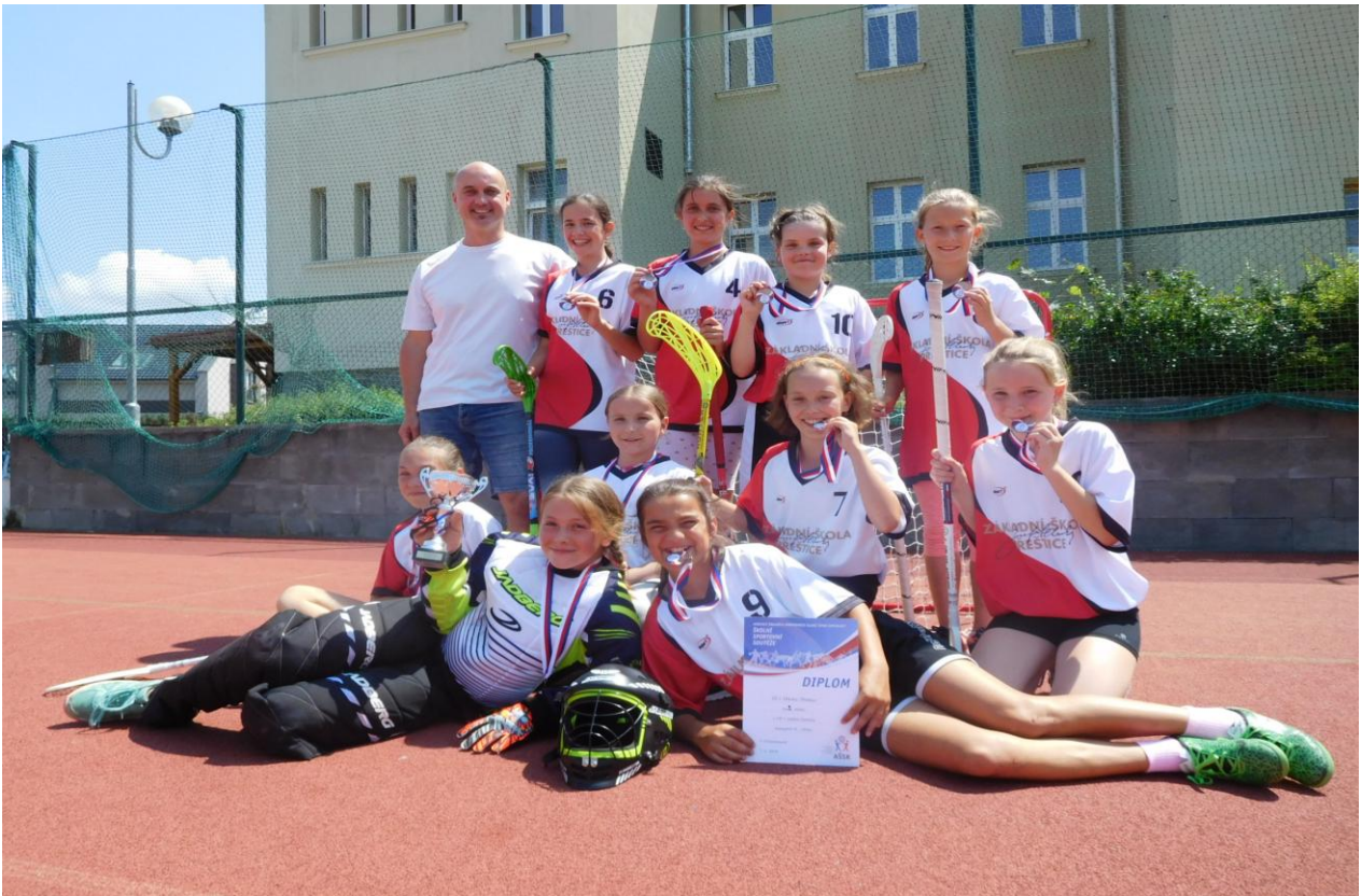
Ve školním roce 2017/2018 vznikl na 1. stupni nový sportovní kroužek – kroužek florbalu a první úspěchy se následně dostavily – družstvo ml. dívek na turnaji v Chlumčanech 3. místo