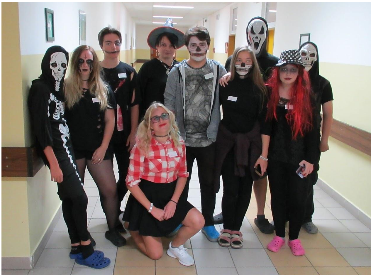
Rozloučení devátáků s pátáky

Škola se systematicky zabývá oblastí prevence rizikového chování žáků a důsledně dbá na to, aby se žáci školy cítili bezpečně jak ve vztahu sami k sobě, tak i ve vztahu k učitelům. Základem této prevence je otevřený dialog, vstřícný vztah učitele a žáka, intenzivní komunikace s rodiči a posilování vzájemné důvěry. Na jednotlivých stupních jsou určeni preventisté, kteří mají na starost přípravu Preventivního programu školy, jeho realizaci během školního roku a organizaci akcí, které jsou zaměřeny na prevenci v různých oblastech. Prevence probíhá v rámci výuky jednotlivých vzdělávacích oblastí, při realizaci průřezových témat i při volnočasových aktivitách. Vedení školy společně s třídními učiteli a koordinátory prevence řeší případné náznaky rizikového chování a při varovných signálech ihned svolává setkání s rodiči a konzultace se žáky, případně přizve ke spolupráci další organizace z oblasti podpory a poradenství. Do oblasti prevence jsou zapojeni všichni žáci školy. Žáci na 1. stupni jsou zapojeni především prostřednictvím Rady dětí. Na 2. stupni pak probíhají adaptační kurzy pro žáky 6. ročníku.