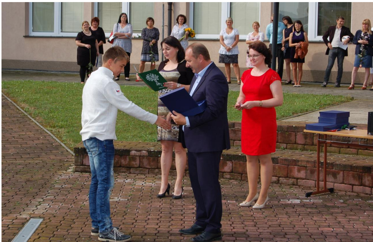
Součástí rozloučení s 9. ročníkem je i odměňování nejlepších žáků a udělování Školního poháru za sportovní reprezentaci