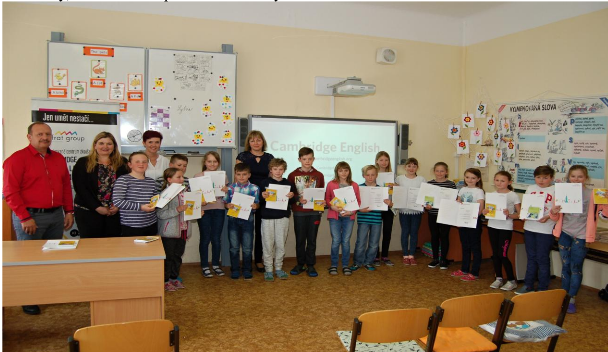
Předávání certifikátů Cambridge na 1. stupni

následně navazující ve 2. ročníku se jeví jako velice přínosné, a to i v dalším období, že škola bude pokračovat v rozvoji jazykových dovedností již od 1. ročníku formou kroužku Start with Magic English (1. ročník) a More Magic English (2. ročník). V letošním školním roce již probíhala výuka v dalších ročnících v kroužku KET a PET na 2. st. a žáci získali i uznávané certifikáty, které obdrželi po složení náročných zkoušek.