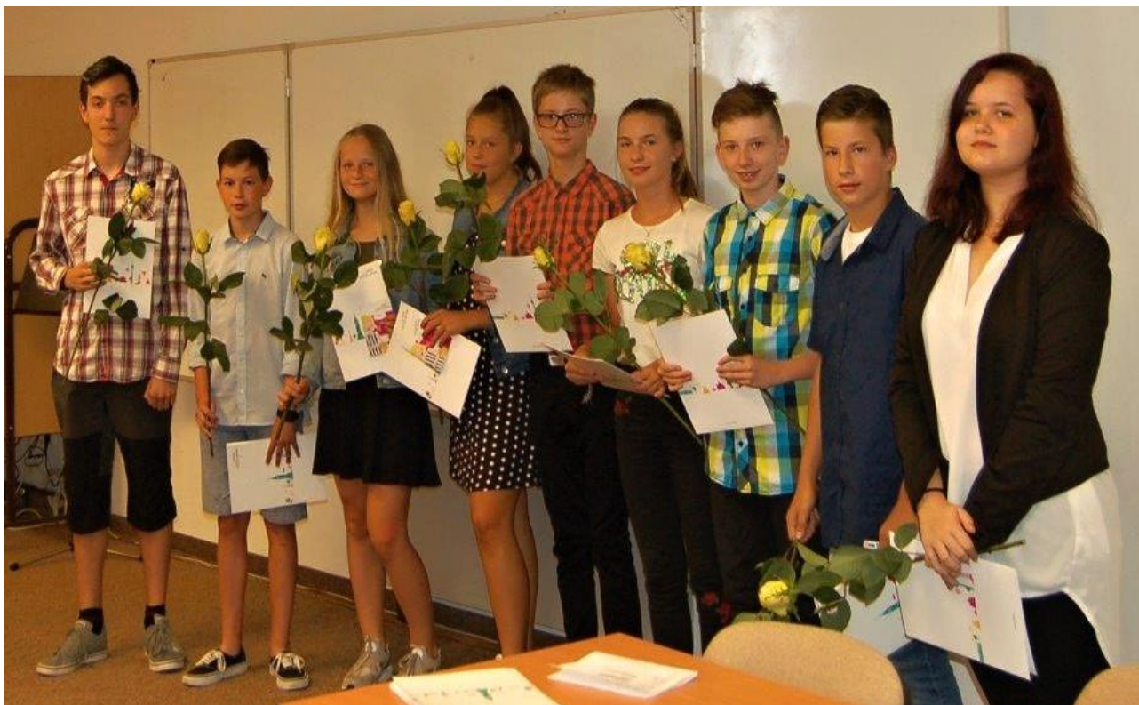
Předávání certifikátů Cambridge na 2. stupni