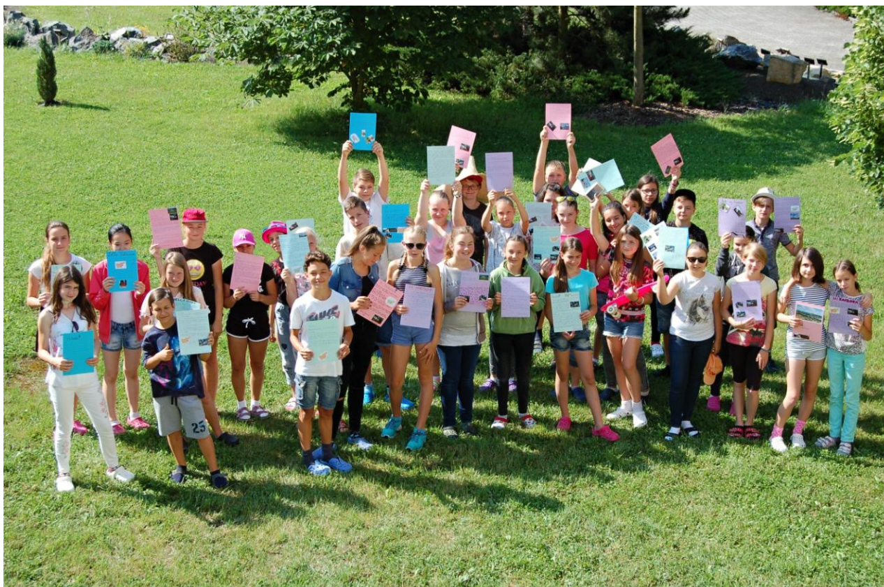
Účastníci projektu „Krško“, který vstoupil do dalšího cyklu

Již deset let trvá naše aktivní spolupráce se základní školou ve slovinském Krško a ani školní rok 2017/2018 nebyl výjimkou. V tomto školním roce jsme zahájili první ročník dalšího tříletého cyklu projektu Krško. Ve stávajících šestých třídách jsme našli čtyřicetku nových členů, které budou po tři roky na projektu pracovat. Během září a října 2017 každý z účastníků připravil svůj profil, kde uvedl základní informace o sobě, své koníčky a záliby a připojil také svoji fotografii. Soubor všech profilů putoval do Krška, kde byly podle nich vytvořeny, pokud možno ideální, dvojice účastníků, které budou po dobu následujících tří let těsněji spolupracovat a hlavně budou navzájem u sebe ubytovány v průběhu chystaných výměnných pobytů. Slovinské děti pak poslaly již adresně svůj profil přidělenému českému kamarádovi.