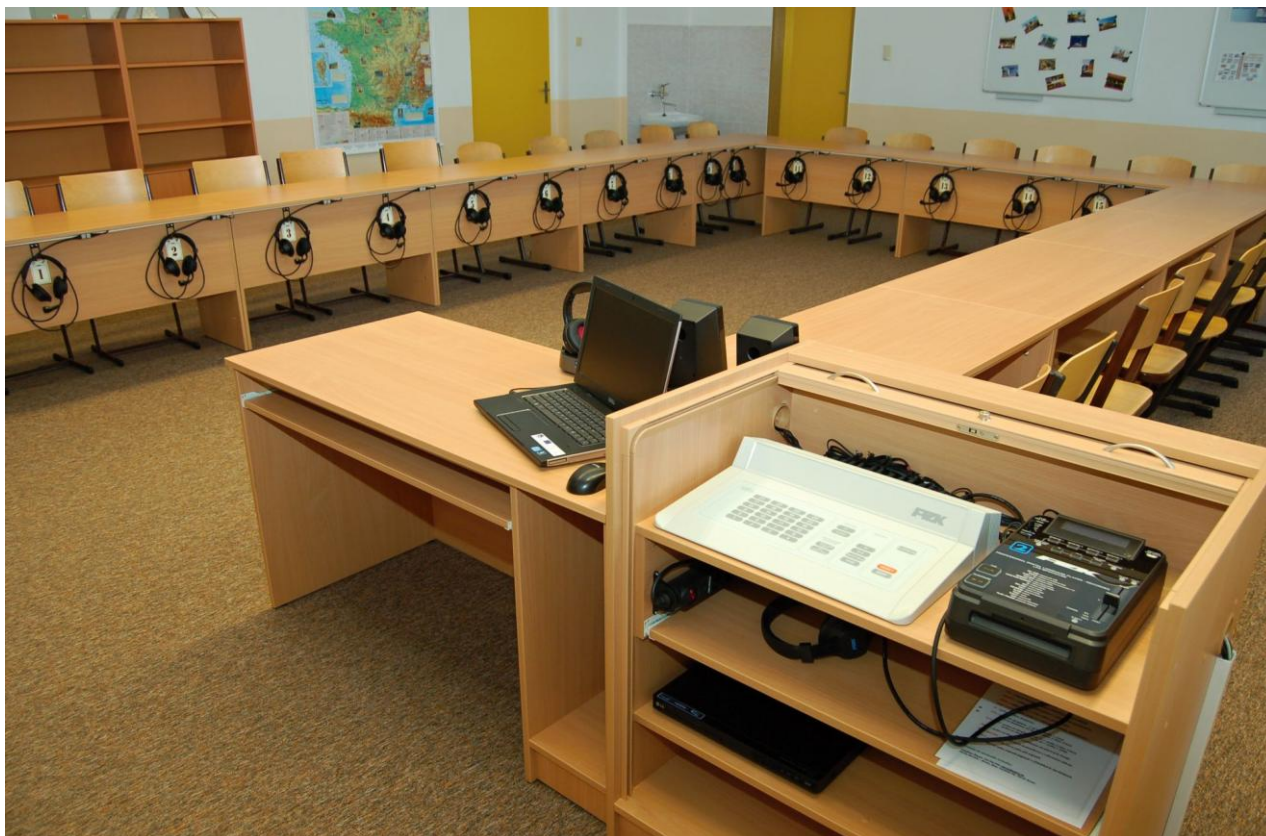
Nová jazyková učebna Na Jordáně financovaná v rámci projektu „Nově k porozumění cizím jazykům“ reg.č. CZ.06.4.59/0.0/0.0/16_075/0008246