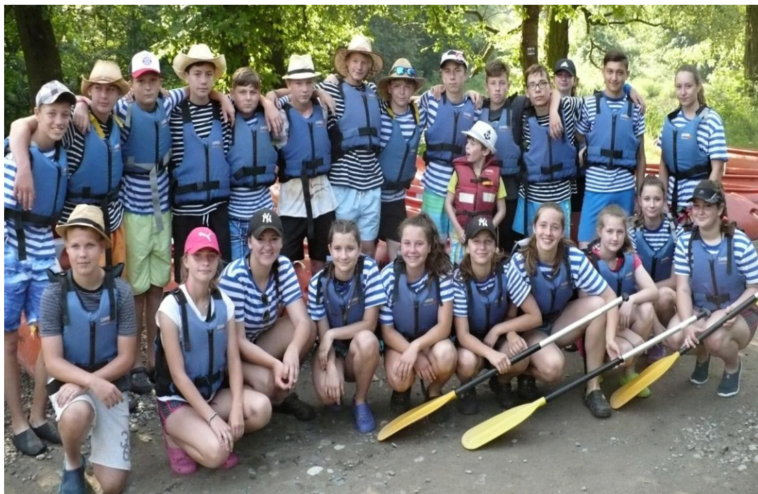
Vodácký kurz 8. ročníku Otava 2017

Základní škola Josefa Hlávky Přeštice nabízí žákům 8. ročníku vodácký kurz a také výběrový kurz lyžování v Rakousku. Nabídka byla rozšířena o zahraniční exkurzi do Švýcarska a také do Dolomit, kterého se poprvé účastnili i žáci 1. stupně. V nabídce rozšířených sportovních aktivit je i kondiční plavání. Všechny sportovní aktivity se následně projevují ve výborném umístění našich žáků ve sportovních soutěžích. Škola zároveň patří mezi nejvýznamnější organizátory sportovních soutěží pro ostatní školy v rámci okresu Plzeň-jih.