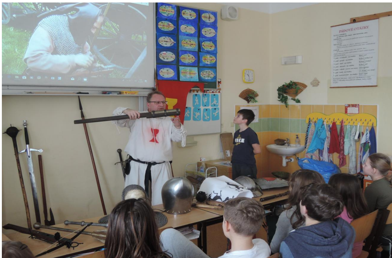
Výukový program o regionální historii „Husité v Západních Čechách“