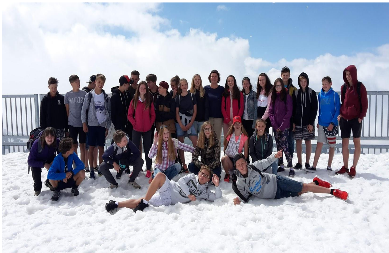
Nedílnou součástí jazykové výuky jsou i poznávací zájezdy – Švýcarsko 2018