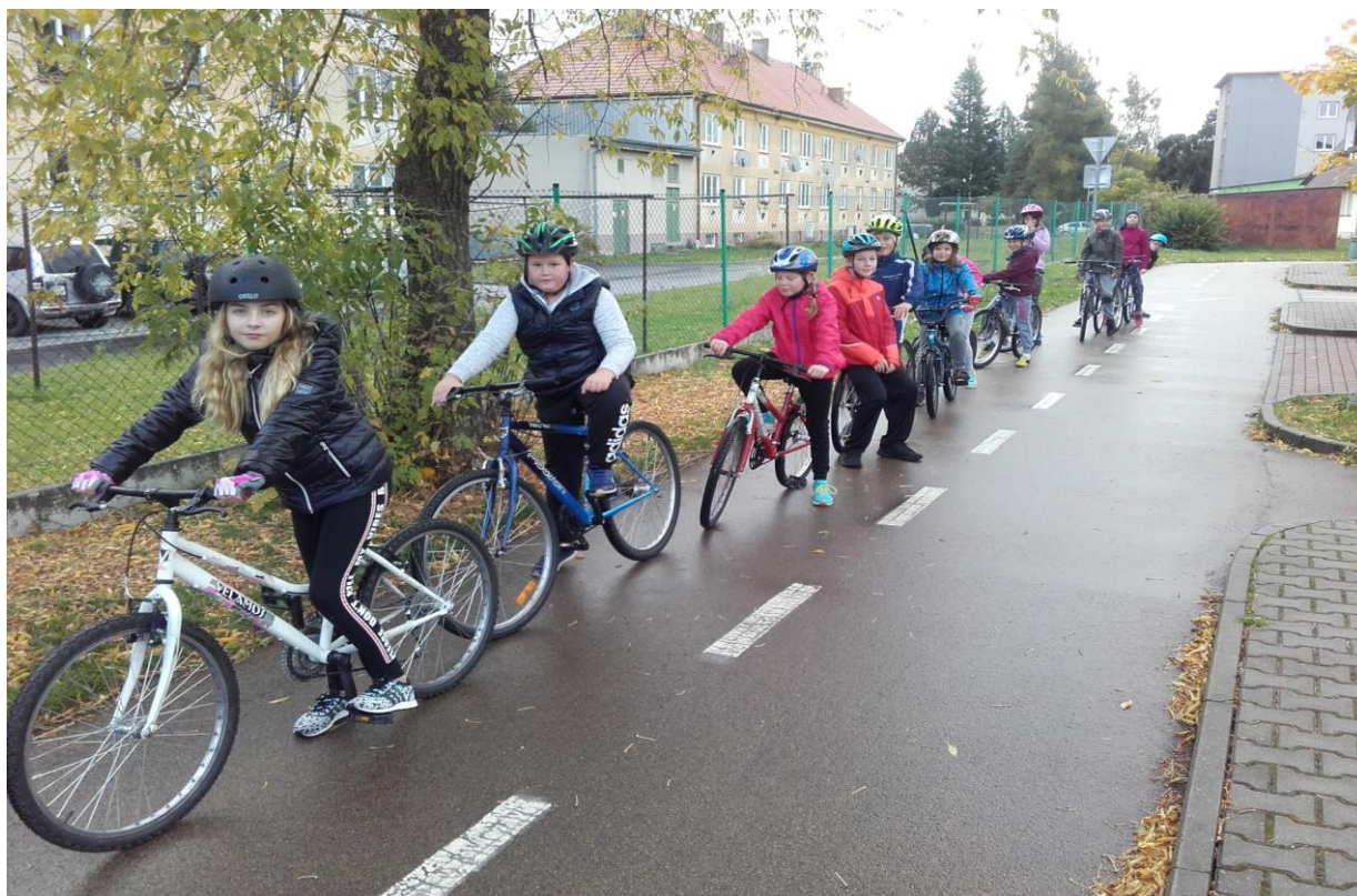
Praktický nácvik zvýšení bezpečnosti v dopravě žáci nacvičují na dopravním hřišti v Blovicích