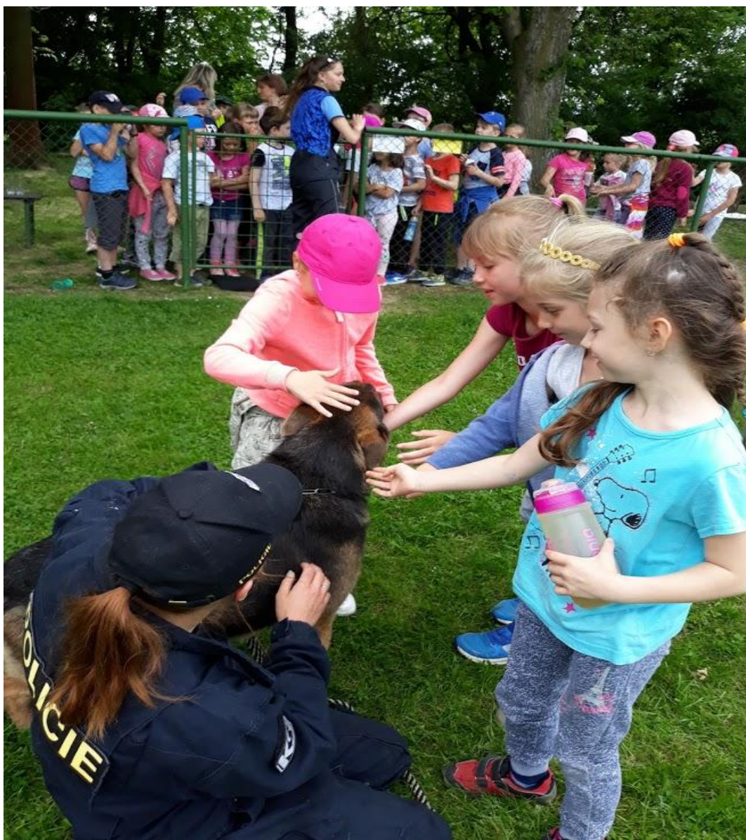
Děti ze školní družiny strávily příjemné slunečné odpoledne u přeštických kynologů, kde zhlédly ukázkou výcviku psů.

Po celý rok je pro žáky připraveno mnoho akcí, při kterých školní družina spolupracuje s MěÚ Přeštice, KKC Přeštice, ZUŠ Přeštice, Městskou policií Přeštice, Městskou knihovnou Přeštice aj. Podrobný seznam akcí za rok 2017/ 2018 je uveden v příloze.