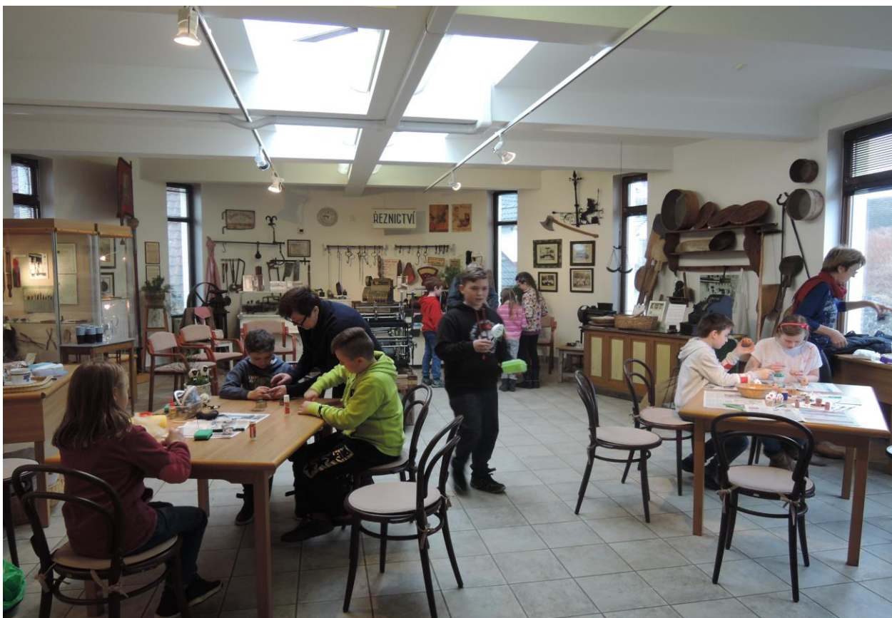
Velikonoční tvoření v Domu historie Přešticka

Mezi nejvýznamnější subjekty, se kterými škola dlouhodobě spolupracuje, patří: Město Přeštice, MěÚ Přeštice a jeho jednotlivé odbory, vedoucí OŠKPP, Školská rada i Rada rodičů při ZŠ Josefa Hlávky Přeštice, Základní umělecká škola, obě přeštické MŠ. Nadále se úzce spolupracuje s Pedagogicko-psychologickou poradnou Plzeň a Střediskem výchovné péče v Plzni. Dalšími významnými subjekty jsou Krajské centrum vzdělávání a Jazyková škola Plzeň, Národní institut pro další vzdělávání, Národní ústav vzdělávání v rámci projektu KIPR, podnikatelské subjekty, Tělovýchovná jednota Přeštice a Tělocvičná jednota Sokol Přeštice, Kulturní a komunitní centrum Přeštice, Městská knihovna Přeštice, Dům historie Přešticka, Policie ČR, Městská policie Přeštice. Úzká spolupráce byla navázána také s jazykovou školou Eufkrat.