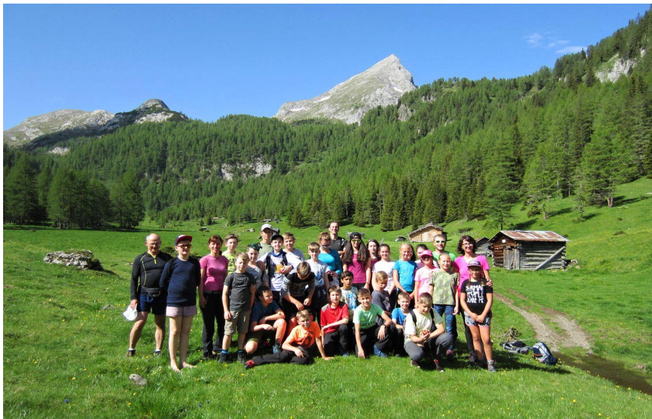
Turisticko poznávací zájezd pro žáky 1. a 2. st. do Dolomit