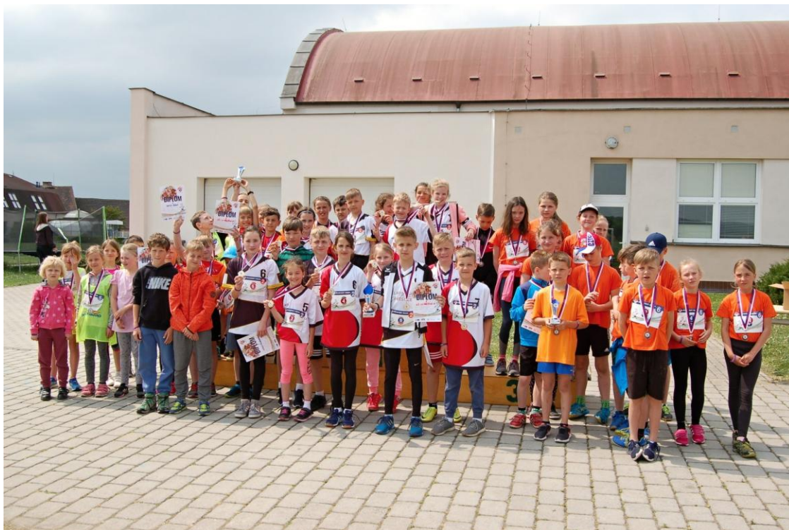
Štafetový pohár patří mezi tradiční soutěže pořádané naší školou