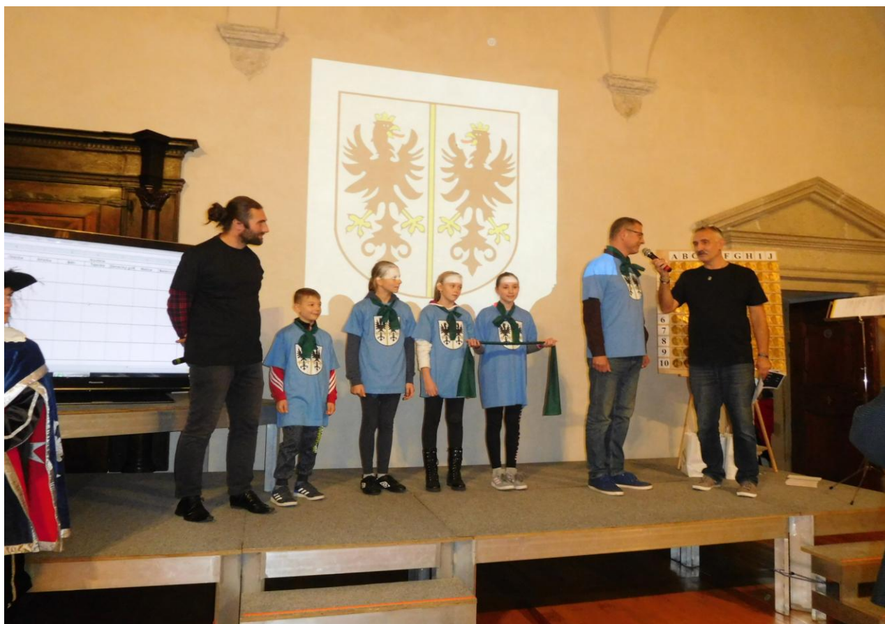
V rámci 10. ročníku Juniorfestu, který probíhal ve dnech 4. – 11. 11. 2017, reprezentovali žáci 1. stupně město Přeštice i školu v soutěži „Pevnost Týn“