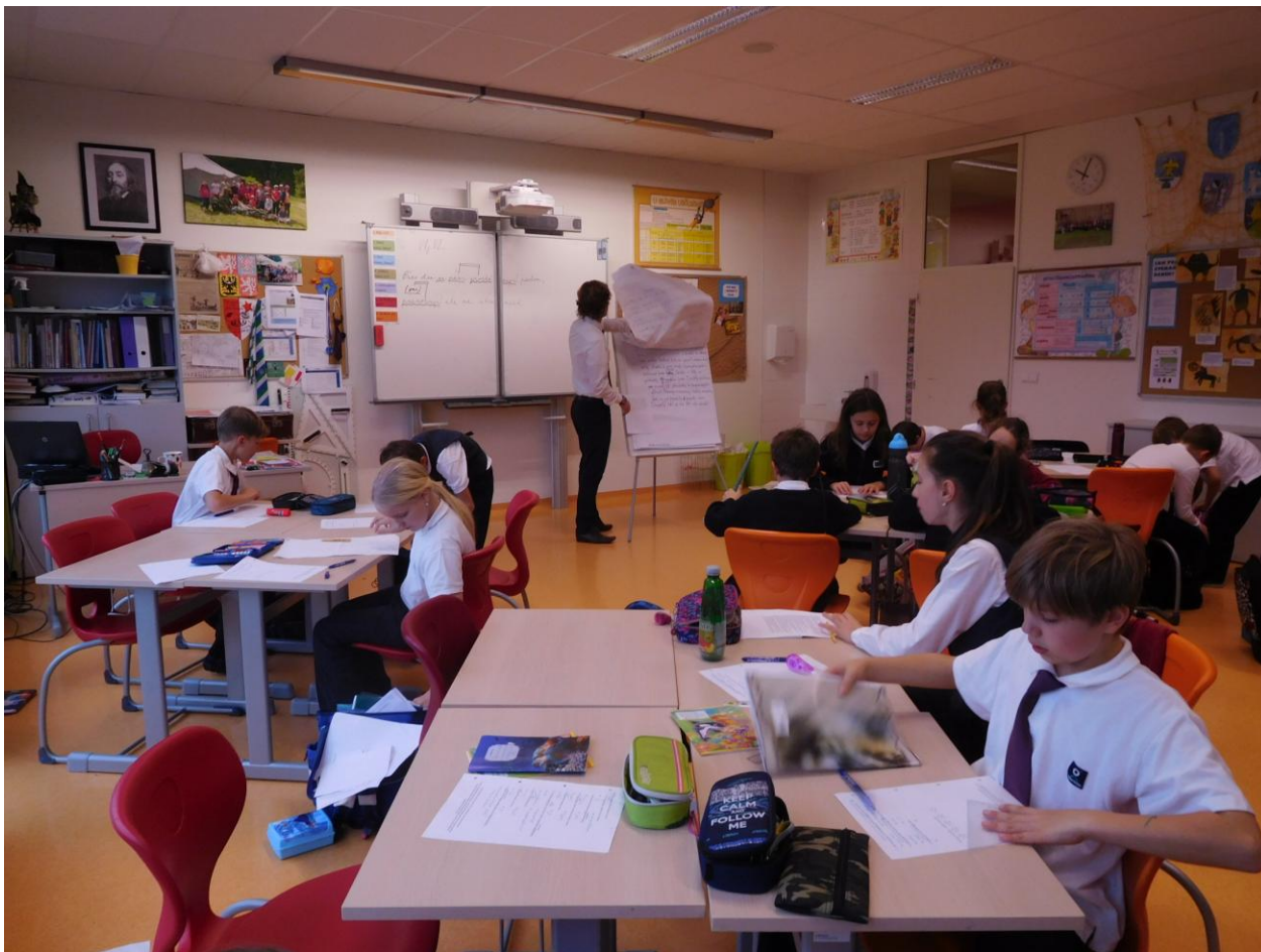
Návštěva soukromé školy OPEN GATE

V rámci dalšího vzdělávání ve spolupráci s MAS Aktivios ve školním roce 2017/2018 navštívili 30. listopadu vybraní pedagogové, především jazykového zaměření, spolu s vedením školy, školu OPEN GATE, kde se seznámili s prostředím této soukromé školy a na společné diskuzi porovnávali výukové metody v soukromé a státní škole. Pro obě strany byla tato návštěva velkým přínosem.