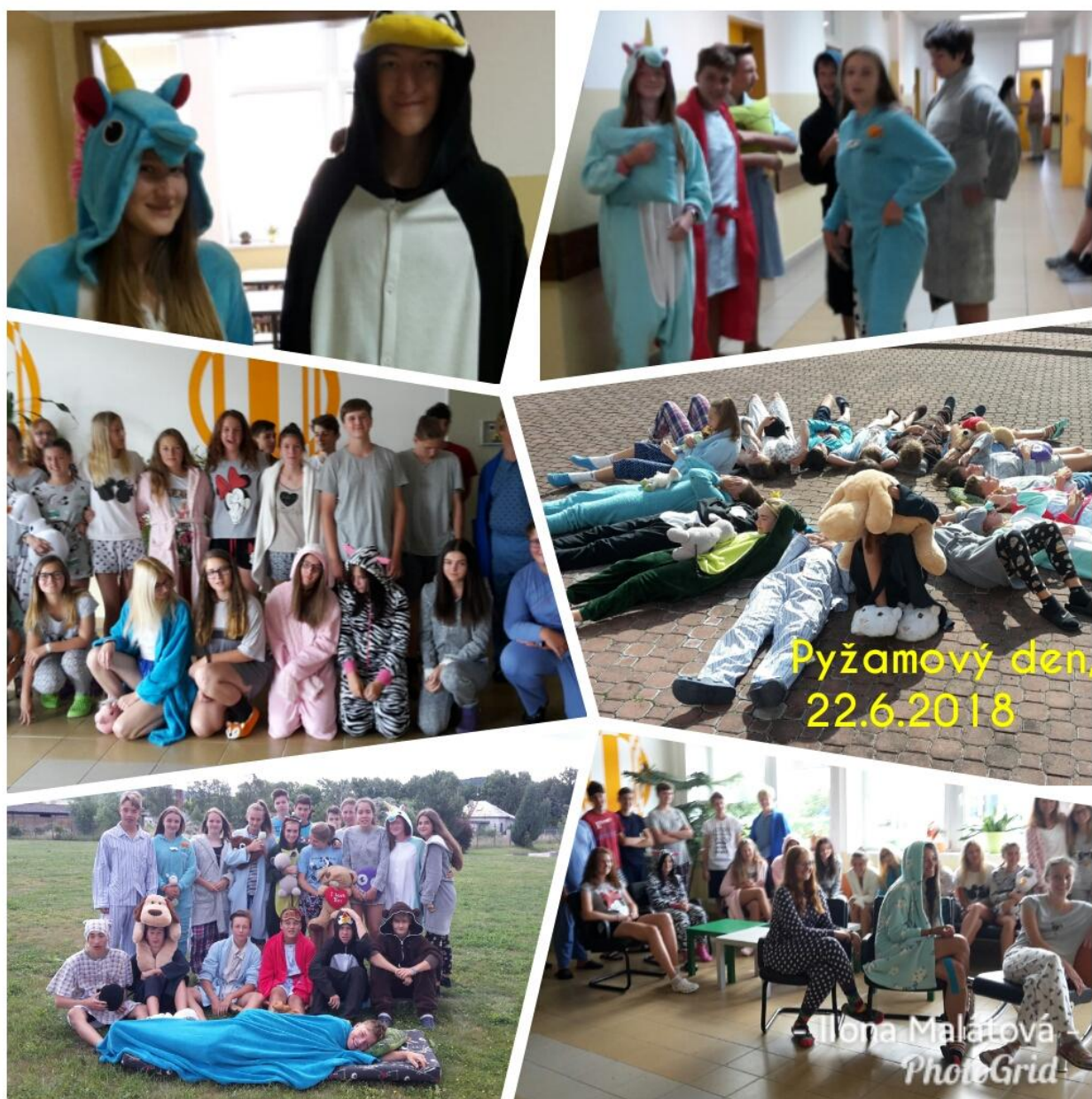
Oblíbenou akcí u 9. ročníku byl „Pyžamový den“