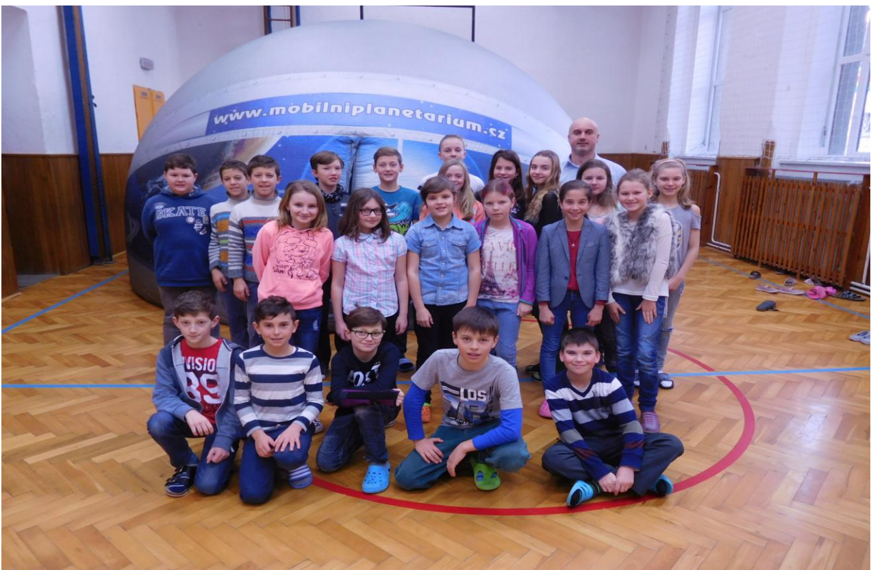
Oblíbený výukový pořad je mobilní planetárium