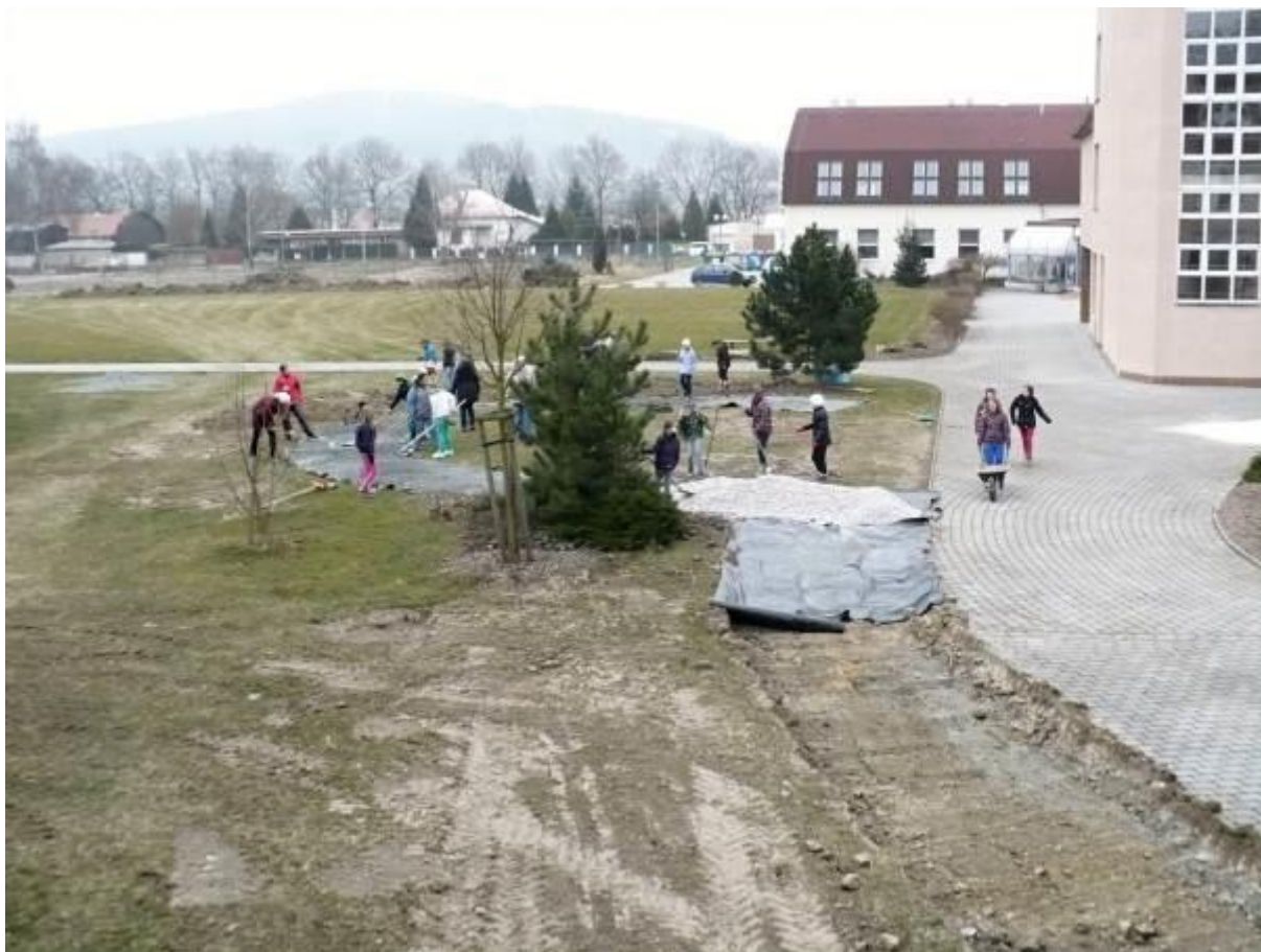
Zahajovací práce na realizaci Arboreta - projekt Zelená škola